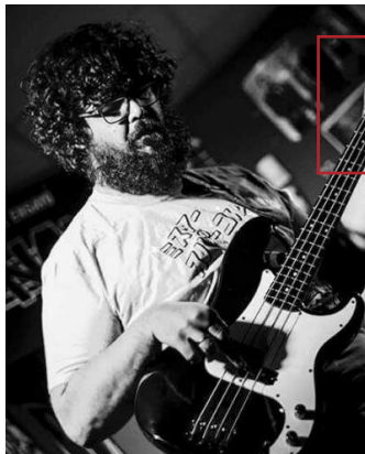
HISTORIA DEL ROCK

Captar la esencia de un instante especial y plasmarlo en una fotografía capaz de transmitir esa sensación es mi principal objetivo.